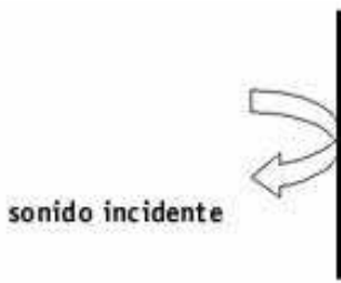
Figura 2. Esquema de incidencia de una onda acústica sobre un cuerpo de elevada densidad.