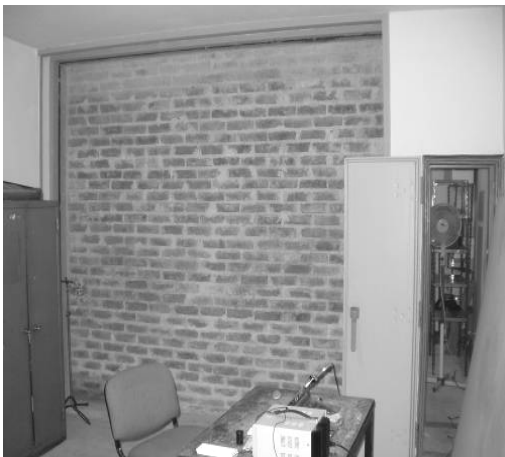
Figura 4: Vista del muro de ensayo