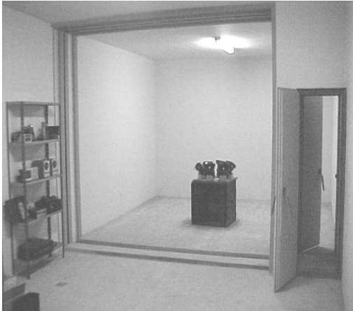
Figura 3: Vista interior de los recintos.